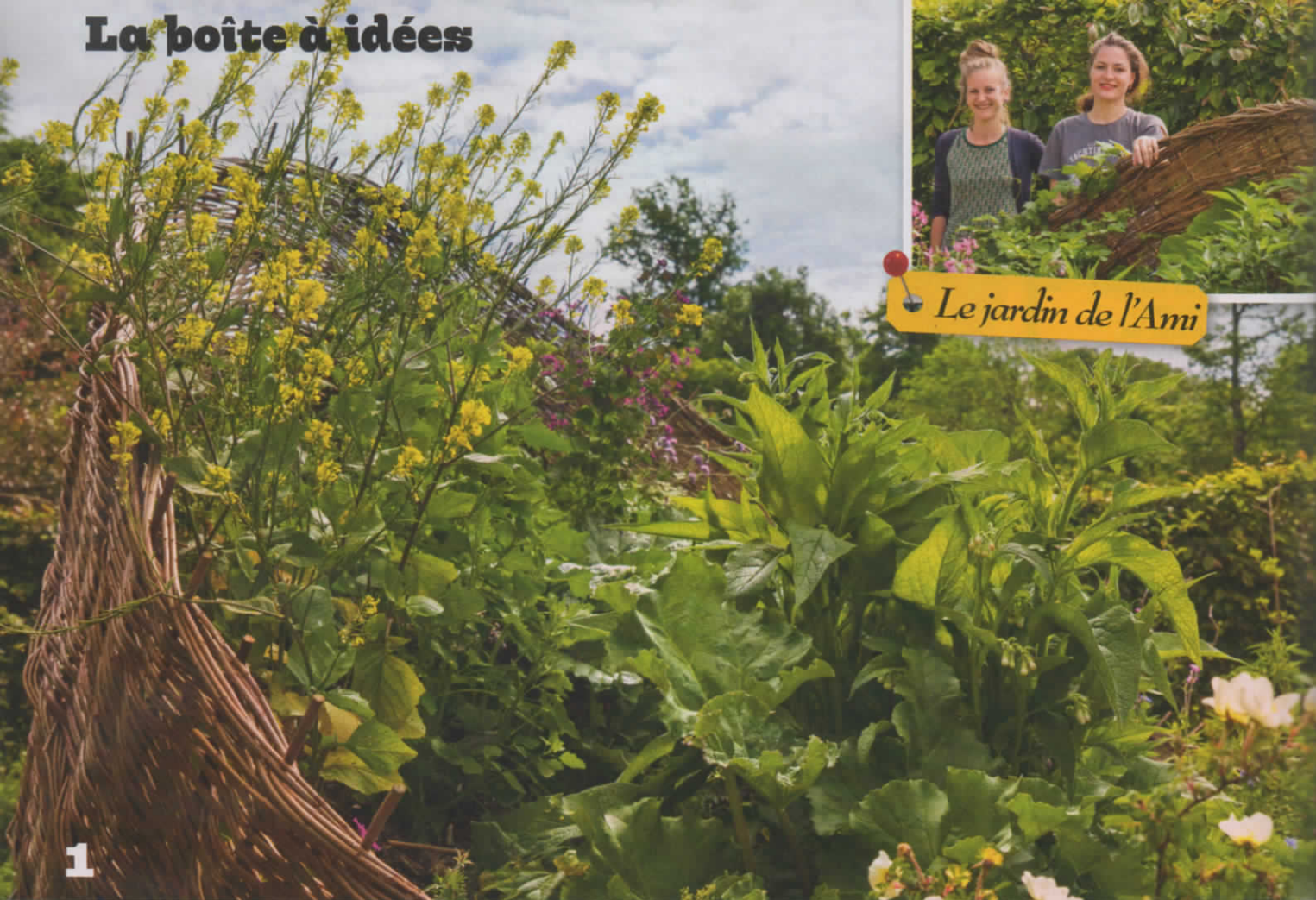
Le jardin de l'Ami